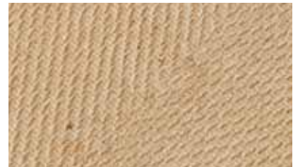
Finish-Oberfläche der STEICO top Dämmplatten

Darüber hinaus sind STEICO top Dämmplatten hoch diffusionsoffen. Sollte doch einmal Feuchtigkeit eindringen, kann sie problemlos verdunsten. Bei anderen Dämmstoffen wirken die - für die Abdeckung - notwendigen Holzwerkstoffplatten wie eine obenliegende Dampfbremse. So reduziert STEICO top deutlich das Risiko von Schimmelbildung.